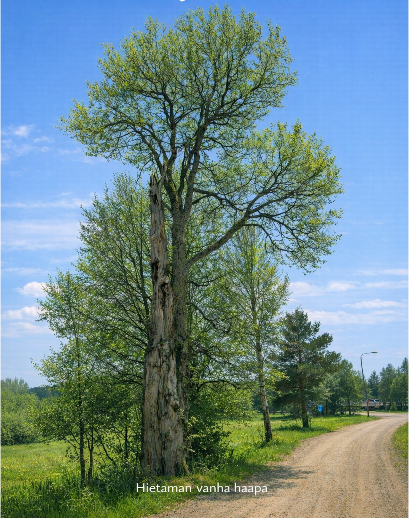
Hietaman vanha haapa