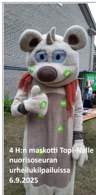
4 H:n maskotti Topi-Nalle nuorisoseuran urheilukilpailuissa 6.9.2025

Luettelo yrittäjistä löytyy: https://aane Koski.4h.fi/4h-yritys/aane Kosken-yritykset/